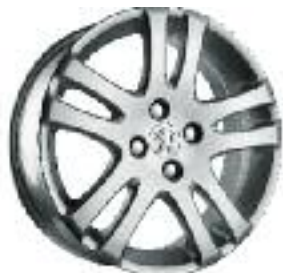
Llanta de aleación Cotya 15"

La información y las ilustraciones que figuran en este folleto se basan en las características técnicas vigentes en el momento de la impresión del presente documento (Junio 2011). El equipamiento presentado en los vehículos fotografiados es de serie u opcional según las versiones. En el marco de una política de mejora constante del producto, Peugeot puede modificar sin preaviso las características técnicas, el equipamiento, las opciones y los tonos. De esta manera, este folleto constituye una información de carácter general y no un documento contractual. Para toda información complementaria, te rogamos dirigirte a tu concesionario. Fotos y equipamientos no contractuales.