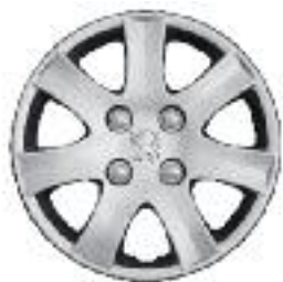
Embellecedor SPA 14"